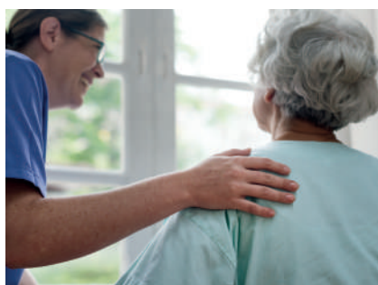
CASE DI RIPOSO